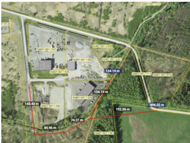
Joonis 2. Alternatiivne teekoridor Maa-ameti kaardi väljavõttel.

Edastada Transpordiametile väljavõtte uuendatud üldplaneeringu kaardist ja seletuskirjast, kus on selgitatud lahendusi.